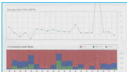
Figura 2: Sesiones 6 a 9

La figura 2 ( tratamiento de la sesión 6 a la 9) muestra un movimiento hacia un aumento de coherencia. En general, el promedio de latidos del corazón del niño bajó considerablemente durante las sesiones, aunque aun hay una sesión en la cual muestra un rango extremadamente alto. En cerca de tres cuartos de las sesiones mostradas, él es ahora capaz de lograr entre 25 – 75% de coherencia media – alta; y su proporción/porcentaje del ritmo de su corazón coherente ( el segmento verde) también ha aumentado.