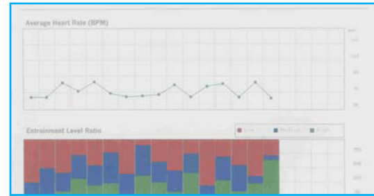
Figura 3; Sesión 10 a 12

Finalmente en la figura 3 (sesiones de tratamiento de la 10 a la 12) vemos que el promedio del rango del corazón de este niño ha decrecido aún más y se ha vuelto muy estable de sesión a sesión. (Notar que ya no hay picos extremos en este registro). Su habilidad para generar un ritmo cardiaco de coherencia media a alta, ha aumentado substancialmente indicando un aumento en la estabilización del sistema nervioso y aumentando la sincronización y armonía en la actividad cardiaca cerebral y de otros procesos del cuerpo. De particular importancia es el hecho de que este niño tenía arritmia cardiaca al principio del tratamiento, cosa que ya no estuvo presente al final de las sesiones; lo que fue confirmado por el cardiólogo Dr. Héctor Briseño.